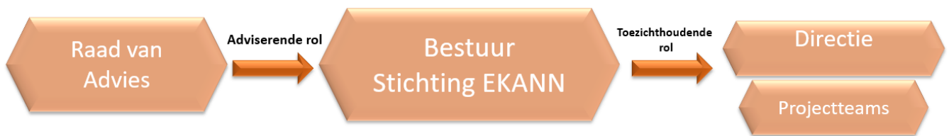
Figuur 1 - Organogram Stichting EKANN